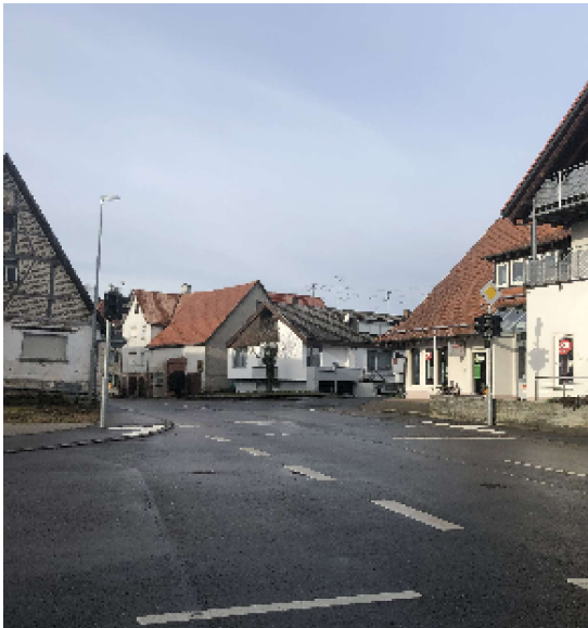
Ampel in der Poststraße: Bitte möglichst diesen Übergang benutzen.