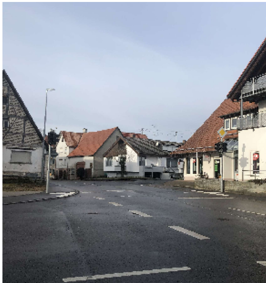
Ampel in der Poststraße: Bitte möglichst diesen Übergang benutzen.