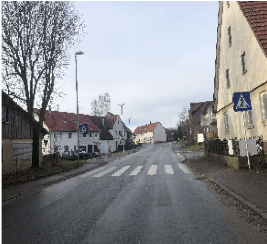
Nutzen Sie den Zebrastreifen an der Hauptstraße (Poststraße)